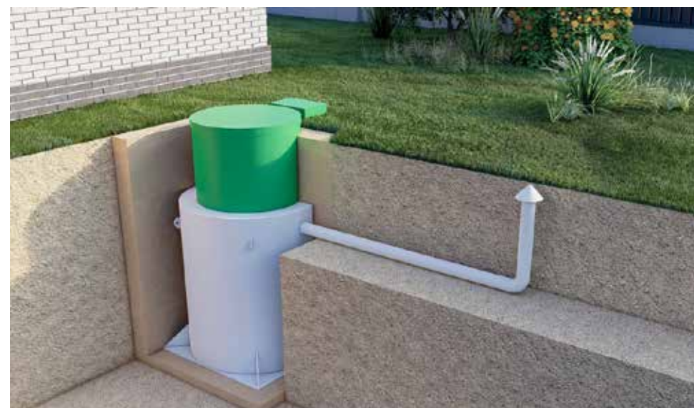
3. Самотеком в рассасывающую траншею или на поля фильтрации