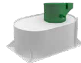
PEGAS мини (при высоком УГВ)